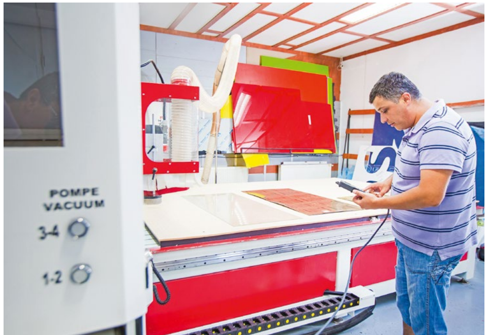
Im Rahmen des KMU-Projekts in Rumänien konnte ein Unternehmen eine Werkzeugmaschine zu kaufen, die durch den Einsatz moderner Steuerungstechnik 3-D-Werbeprodukte automatisch zuschneiden kann.

Acht Jahre nachdem Volk und Stände das Bundesgesetz über die Zusammenarbeit mit den Staaten Osteuropas angenommen haben, ist der Erweiterungsbeitrag zu einem wichtigen Bestandteil der schweizerischen Europapolitik geworden. Insgesamt befinden sich rund 300 Projekte in der Umsetzung. Nach der Verpflichtung von 1 Mrd. Franken für die EU-10-Staaten konnte bis Ende November 2014 auch der vom Parlament für Bulgarien und Rumänien bewilligte Rahmenkredit von 257 Mio. Franken vollständig für prioritäre Projekte verpflichtet werden. Das Parlament wird am 11. Dezember den Rahmenkredit über 45 Mio. Franken an Kroatien, welches der EU am 1. Juli 2013 beigetreten ist, beraten. Von allen Veränderungen im Umfeld des Erweiterungsbeitrags hatte die Aufwertung des Schweizer Frankens bisher die grössten direkten Auswirkungen.