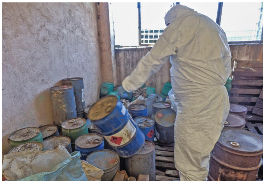
Rund 4500 Tonnen giftige Pflanzenschutzmittel lagern in Bulgarien. Mithilfe von 19,9 Mio. Franken aus dem Schweizer Erweiterungsbeitrag wird Bulgarien diese entsorgen und veraltete Lagerhäuser sanieren können.